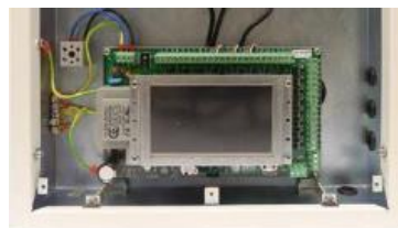
Panel control y alarmas